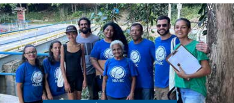
Visita técnica no Sana