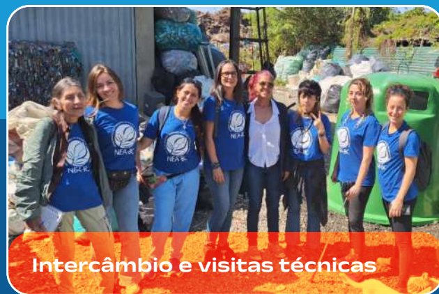
Intercâmbio e visitas técnicas