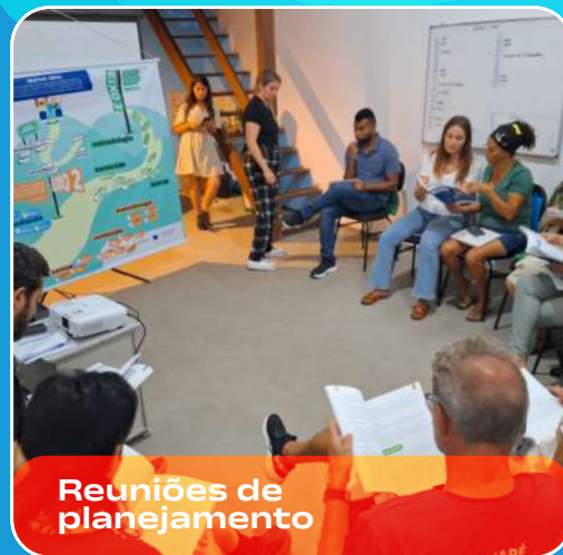
Reuniões de planejamento