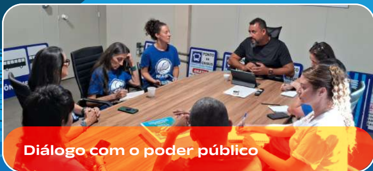
Diálogo com o poder público