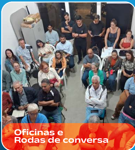
Oficinas e Rodas de conversa